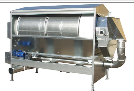
KDC 4000/8000 Rumpupuhdistin