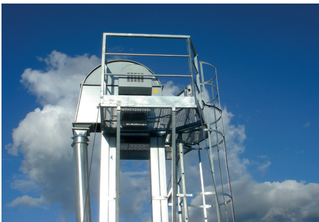
▲ Elevaattorin putkessa huoltotaso ja tikkaat suojakaiteella vapaastiseisovassa kuppielevaattorissa.

Kuljetusjärjestelmämme ovat täydellisiä viljan, papujen, rypsin, pellettien, jauhojen, rehusekoitusten yms. pystysuoraan kuljettamiseen. Niille on ominaista pitkä käyttöikä ja luotettavuus sekä matala virrankulutus tehon verrattuna