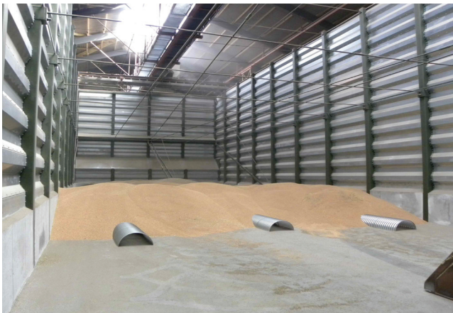
Kanalafstand ved tørring: Korn 100 cm. Frø 80 cm

GP-1600 sidekanal er beregnet for kanallængder op til 10 - 12 m i frø og 12 - 18 m i korn (tørring)